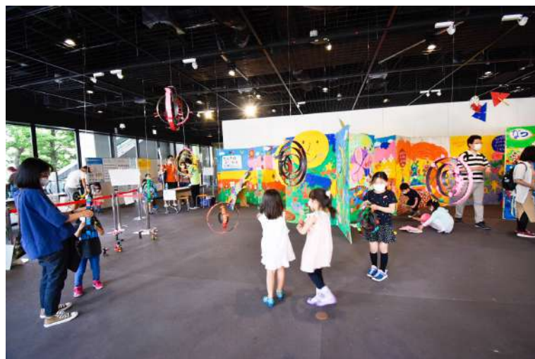
新感覚！宇宙ドミノ展示（天吊り）