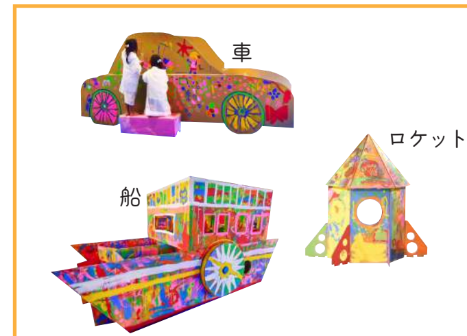
ダンボール造形（乗り物）