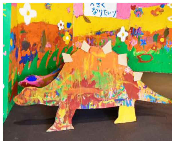
ダンボール造形（恐竜）