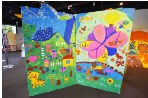
⑥ 巨大絵本 W4m×H2m×D1.5m