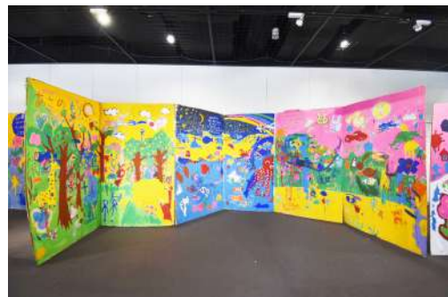
③ 巨大絵本 W5.5m×H2m×D1.5m