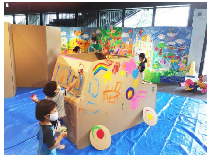
体験型アートワークショップ