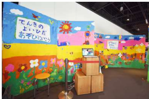
① 巨大絵本 W5.5m×H2m×D1.5m