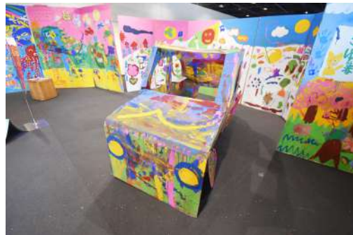
⑩ WSエリア・車 W1m×H1.8m×D1m