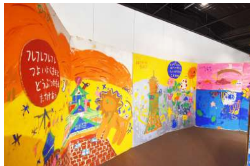
② 巨大絵本 W5.5m×H2m×D1.5m