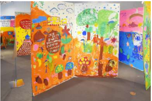
⑨ 巨大絵本 W4m×H2m×D1.5m