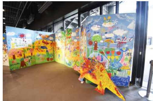
⑪ 巨大絵本 W5.5m×H2m×D1.5m