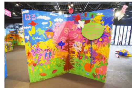
⑧ 巨大絵本 W4m×H2m×D1.5m