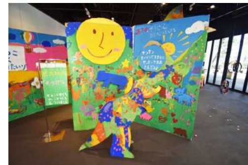
④ 巨大絵本 & 恐竜 W4m×H2m×D1.5m