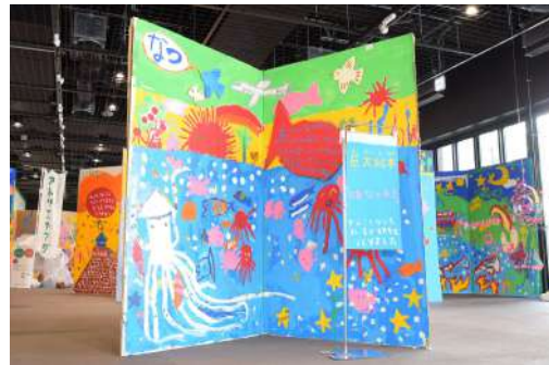
⑦ 巨大絵本 W4m×H2m×D1.5m