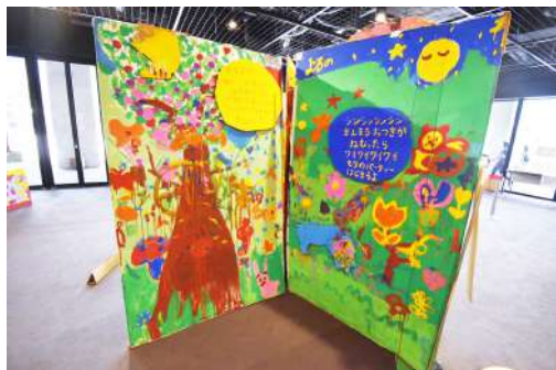
⑤ 巨大絵本 W4m×H2m×D1.5m