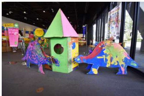
⑭ ロケット & 恐竜 8m×1m×1m