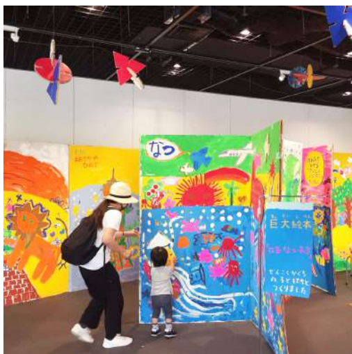
親子で楽しめる巨大絵本の展示