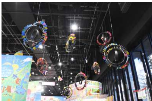
⑬ 宇宙ドミノ 50cm/個・1kg