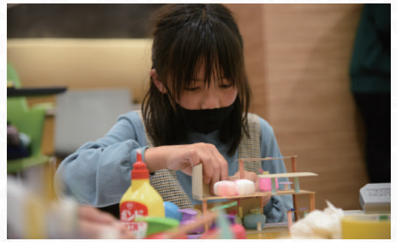
時間を忘れて夢中でつくれる