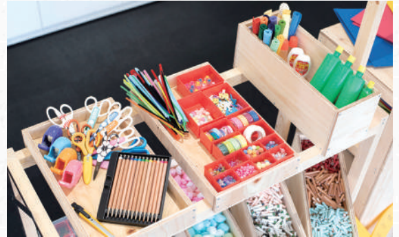
便利な道具や珍しい端材をたくさん使える